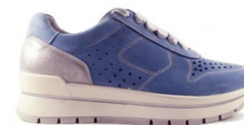
JOSEFA 35-42 | Bleu CHUT