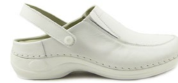
DUBAI 35-42 | Blanc CHUT