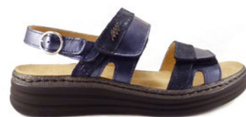
MAURICIO 35-42 | Bleu CHUT