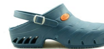
CLOG STUDIUM 35-44 | Bleu