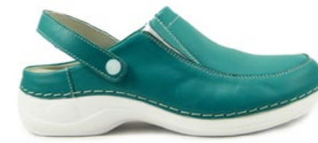
DUBAI 35-42 | Vert CHUT