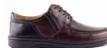
VANDER 39-45 | Marron CHUT