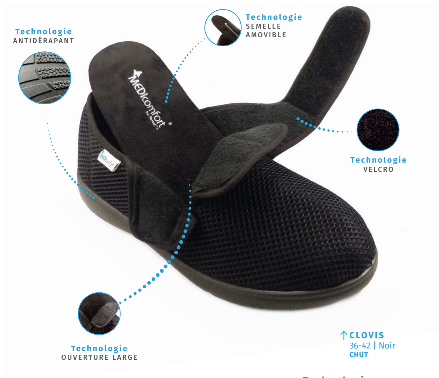
↑ CLOVIS 36-42 | Noir CHUT

Chaussures avec doublure en bambou et fil d'argent, hypoallergénique et avec des propriétés antibactériennes. Système antidérapant qui offre une bonne adhérence lors de la marche.