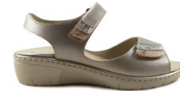
KONRAD 35-41 | Argent CHUT