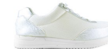
FRANCESCA 35-42 | Blanc CHUT