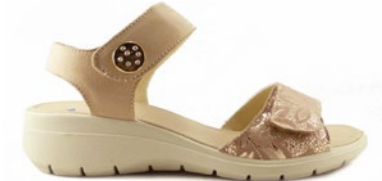
JOYCE 35-42 | D'or