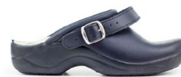
643 35-41 | Bleu