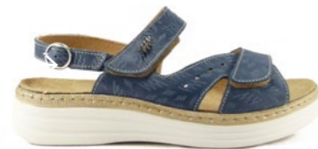
MAINE 35-42 | Bleu CHUT