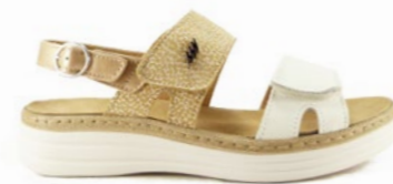
MOLDOVA 35-42 | Beige CHUT