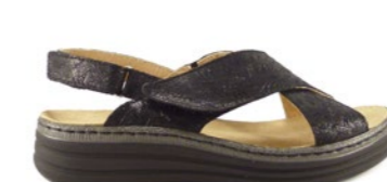
MISSISSIPI 35-42 | Noir CHUT