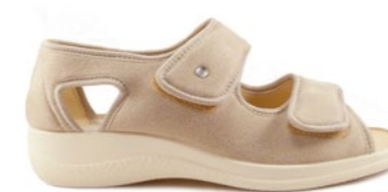
FABIAN 35-42 | Beige CHUT