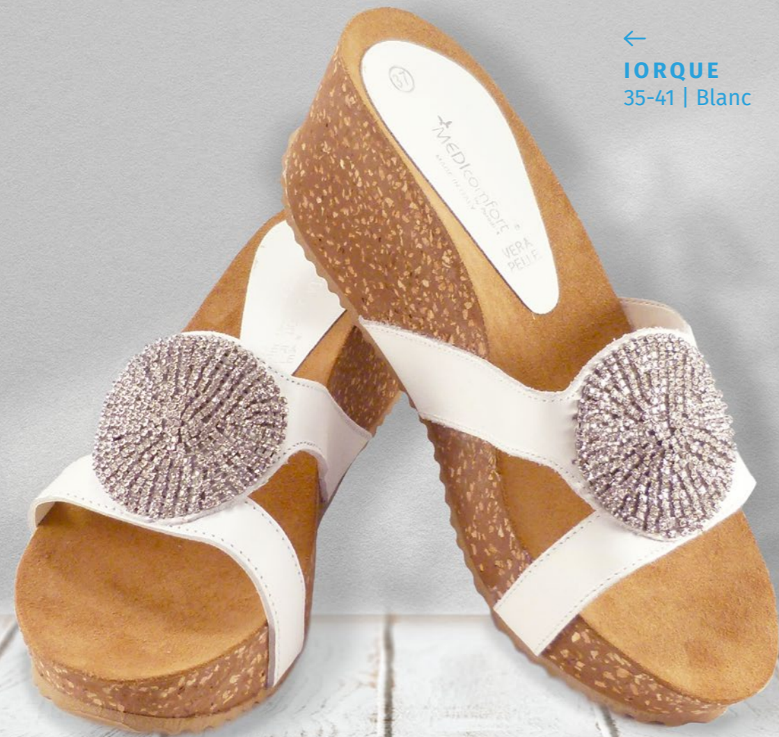
← IORQUE 35-41 | Blanc