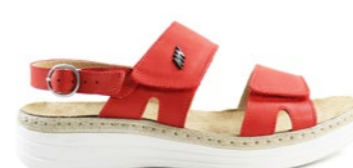
MELODYS 35-42 | Rouge CHUT