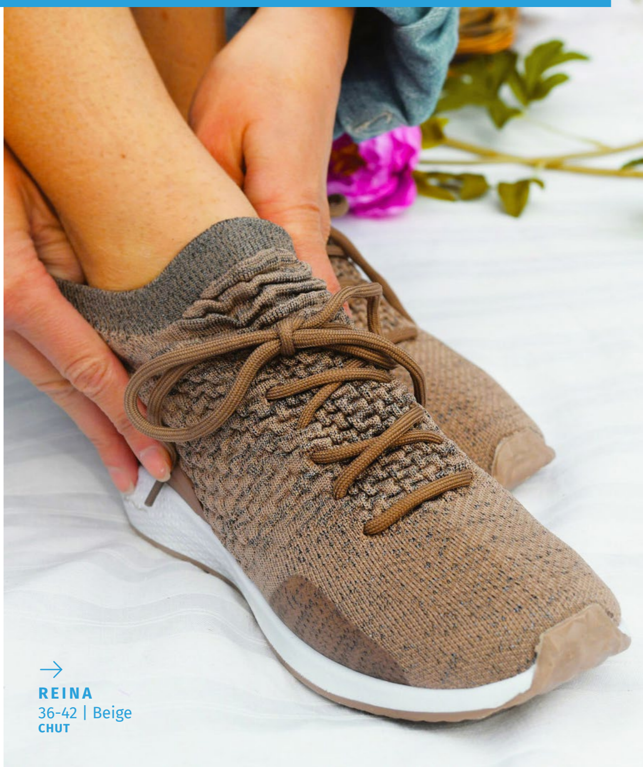
→ REINA 36-42 | Beige CHUT