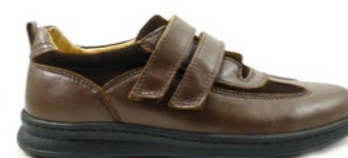
VON 39-45 | Marron CHUT