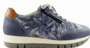
KRISTIN 35-41 | Bleu CHUT