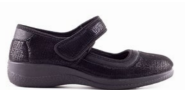
FLORI 35-42 | Noir, Beige CHUT