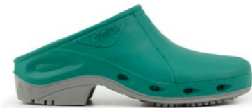
SOCA TROKLÓ 141 35-45 | Vert