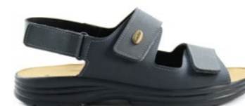
STEVE 40-45 | Gris