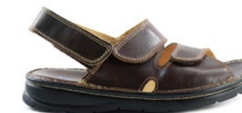
VICHY 39-45 | Marron