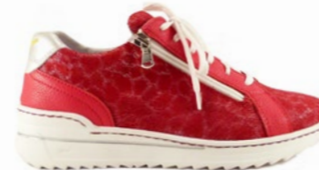
MARROCOS 35-42 | Rouge CHUT