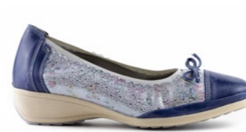
KUMARI 35-41 | Bleu CHUT