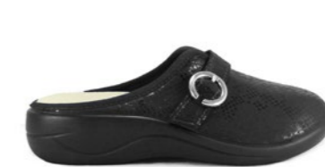
SALETE 35-41 | Noir