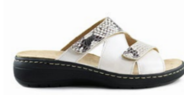
MANARI 35-42 | Beige

VELCRO Velcro adaptable, pliable et simple d'utilisation.