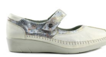
KENDAL 35-41 | Blanc CHUT