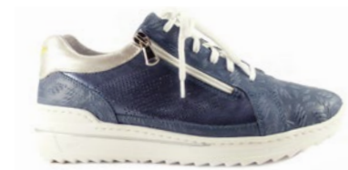
MOE 35-42 | Bleu CHUT