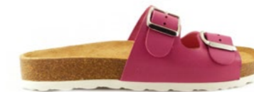
PETRA 35-41 | Rose