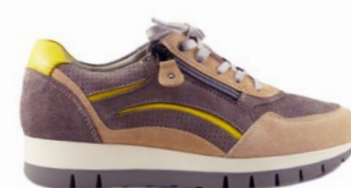
KURY 35-41 | Gris CHUT