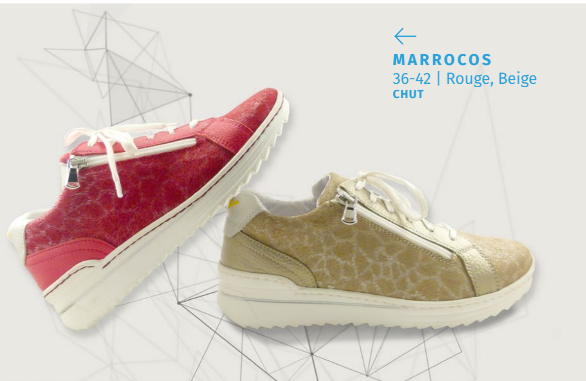
← MARROCOS 36-42 | Rouge, Beige CHUT