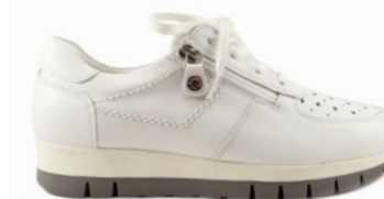
KAL 35-41 | Blanc CHUT