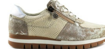
KANELA 35-41 | Doré CHUT