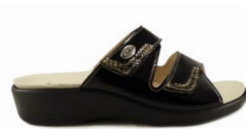
SUSIE 35-41 | Noir