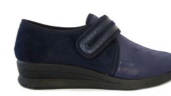
FELINA 35-42 | Bleu CHUT