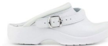
643 35-41 | Blanc