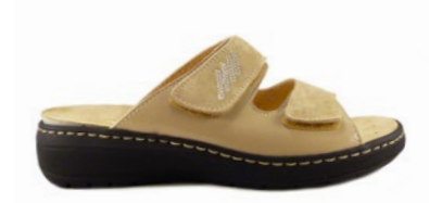
MALAGA 35-42 | Beige, Bleu