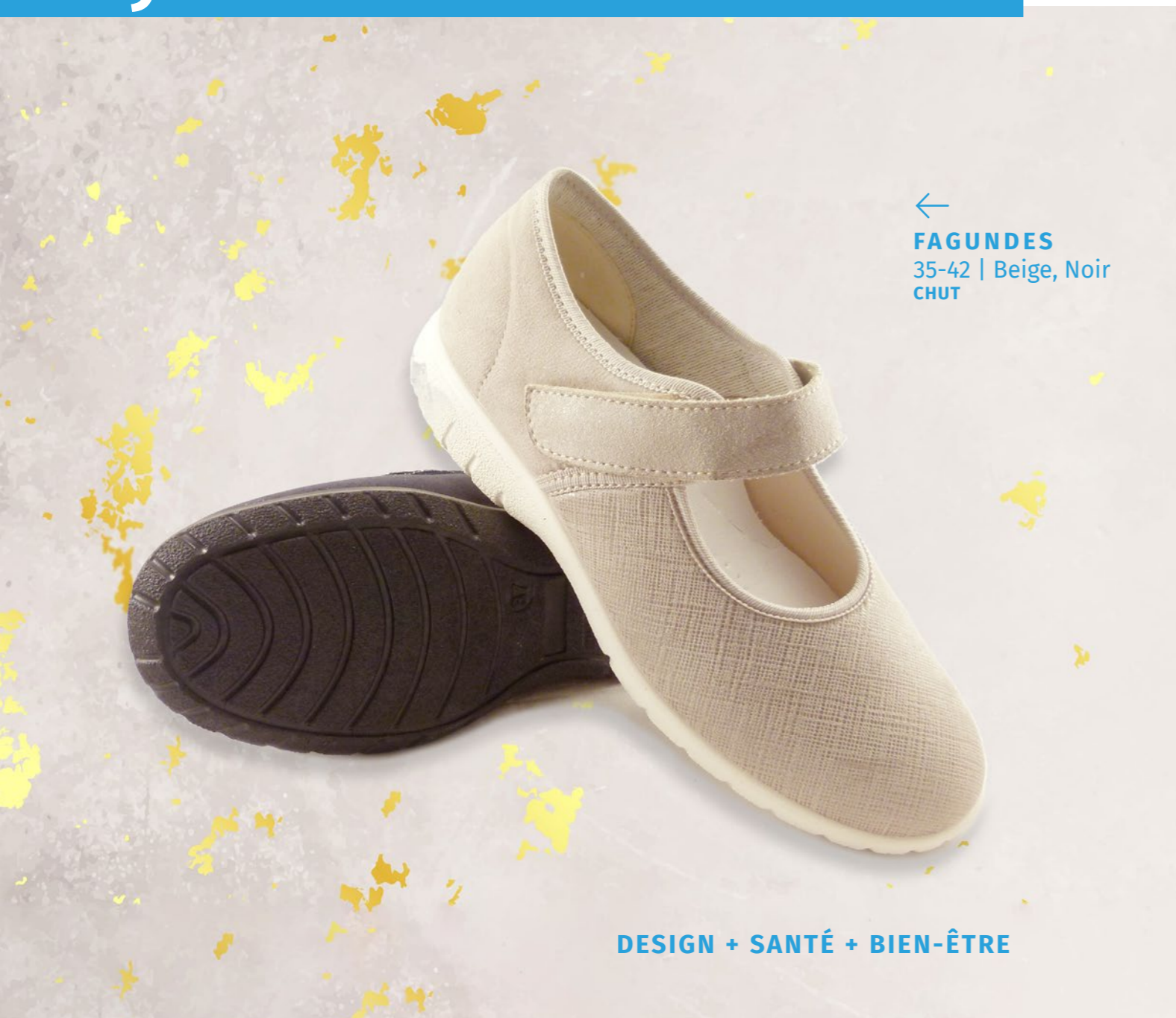
← FAGUNDES 35-42 | Beige, Noir CHUT