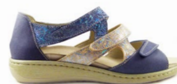
KENAN 35-41 | Bleu CHUT