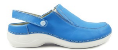
DUBAI 35-42 | Celeste CHUT