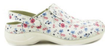
DELI-09F 35-42 | Fleurs CHUT