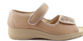
FREDA 35-42 | Beige CHUT