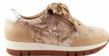
KRISTIN 35-41 | Beige CHUT