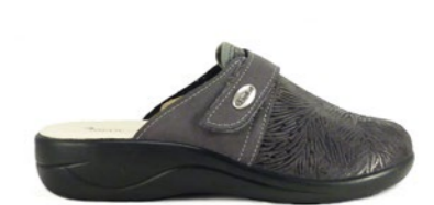
SYLVIE 35-41 | Gris