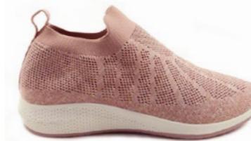
RUBIA 36-42 | Rose CHUT