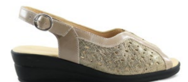
MAELIE 35-42 | Beige, Bleu