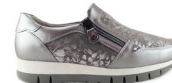
KESIA 35-41 | Argent CHUT