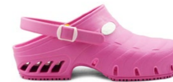
CLOG STUDIUM 35-44 | Rose