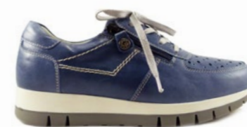
KAL 35-41 | Bleu CHUT