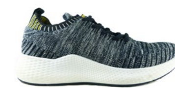
ROME 36-41 | Bleu CHUT