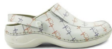
DELI-02M 35-42 | Blanc CHUT