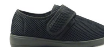
CLOVIS 36-42 | Noir CHUT