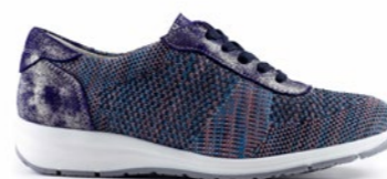
KALINNA 36-41 | Bleu CHUT