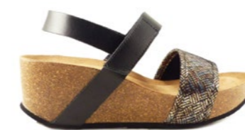
POMPEIA 35-41 | Noir