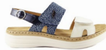
MOLDOVA 35-42 | Bleu CHUT