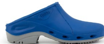
SOCA TROKLÓ 141 35-45 | Bleu