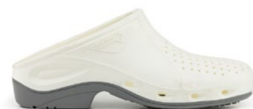
SOCA TROKLÓ 140 35-45 | Blanc