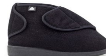
CLOE 36-43 | Noir CHUT