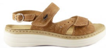
MAINE 35-42 | Marron CHUT