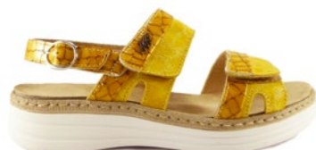
MONIZ 35-42 | Jaune CHUT