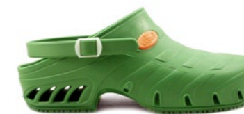
CLOG STUDIUM 35-44 | Vert