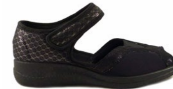
FROIS 35-42 | Noir CHUT