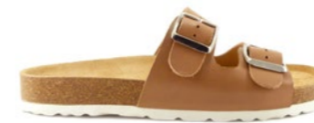
PETRA 35-41 | Marron