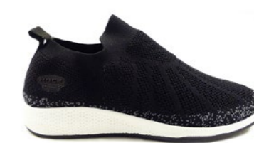
RUBIA 36-42 | Noir CHUT