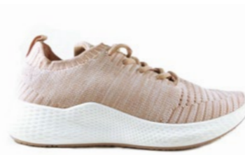
ROME 36-41 | Rose CHUT