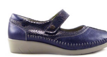
KENDAL 35-41 | Bleu CHUT