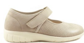
FAGUNDES 35-42 | Beige CHUT