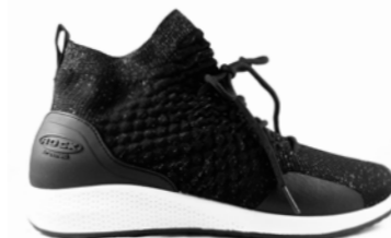
REINA 36-42 | Noir CHUT

Les douleurs articulaires peuvent être traitées. Des chaussures légères, souples et extensibles peuvent aider.