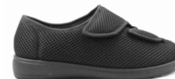
CRIS 36-42 | Noir CHUT