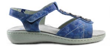
KEITH 35-41 | Bleu CHUT