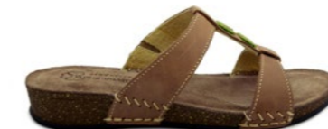
GILMA 35-41 | Marron