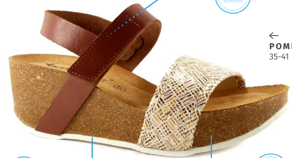
← POMPEIA 35-41 | Marron