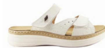
MANOLO 35-42 | Blanc