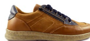
VALDIR 39-45 | Camel CHUT