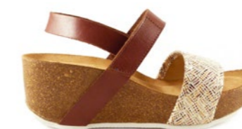
POMPEIA 35-41 | Marron