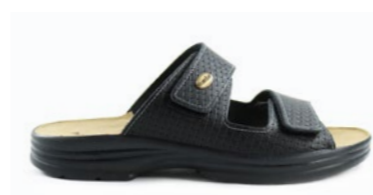
SIMON 40-45 | Noir