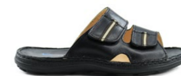
VERSALHES 39-45 | Noir