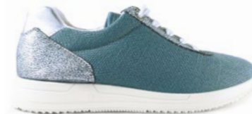
FRANCESCA 35-42 | Bleu CHUT