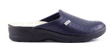
89882 35-41 | Bleu