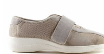
FLIPER 35-42 | Beige CHUT