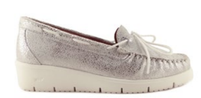
MARSELHA 35-42 | Argent CHUT