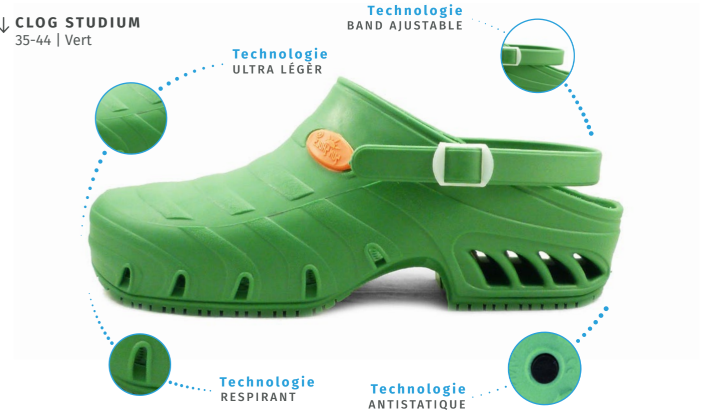
↓ CLOG STUDIUM 35-44 | Vert