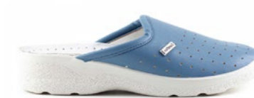
89882 35-41 | Celeste