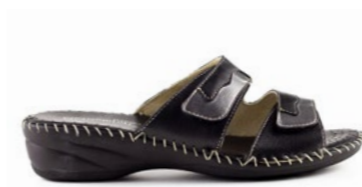
GRECI 35-41 | Noir