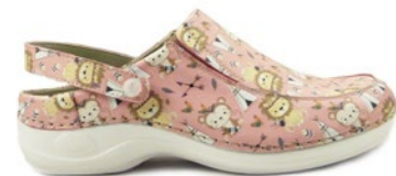
DELI-06I 35-42 | Rose CHUT