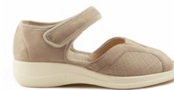
FROIS 35-42 | Beige CHUT