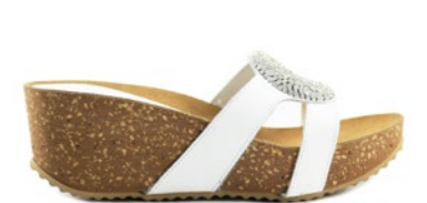
IORQUE 35-41 | Blanc