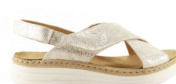
MISSISSIPI 35-42 | Argent CHUT