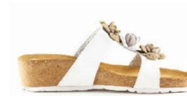
GUATEMALA 35-41 | Blanc