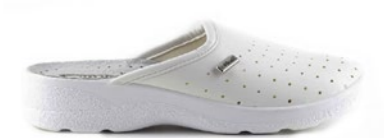
89882 35-41 | Blanc