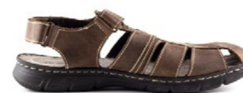
GIORDANA 39-45 | Marron CHUT