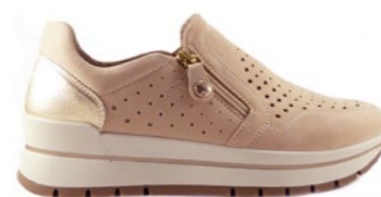
JENIFER 35-42 | Beige CHUT