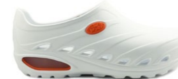
CLOG DINAMIC 35-44 | Blanc