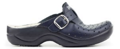
631 35-41 | Bleu, Blanc