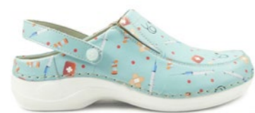
DELI-04S 35-42 | Vert CHUT