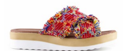
ARIZONA 35-41 | Rouge