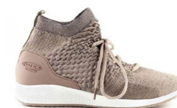
REINA 36-42 | Beige CHUT

Ce modèle de tennis contient un matériau élastique qui aide à prévenir les oignons.