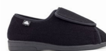
CONSUELA 36-43 | Noir CHUT