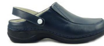
DUBAI 35-42 | Bleu CHUT