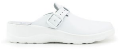
ARIANA 35-41 | Blanc