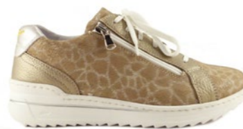
MARROCOS 35-42 | Beige CHUT