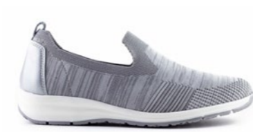
KEN 35-41 | Gris CHUT