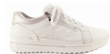
MOE 35-42 | Blanc CHUT