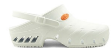
CLOG STUDIUM 35-44 | Blanc