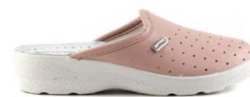
89882 35-41 | Rose