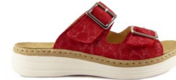
MARISOL 35-42 | Rouge