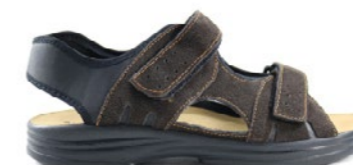
SIMBA 40-45 | Marron