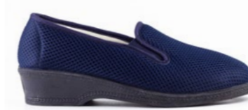
OLGA 35-41 | Bleu CHUT