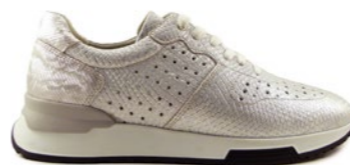
KAAB 35-41 | Argent CHUT