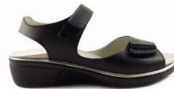
KONRAD 35-41 | Noir CHUT