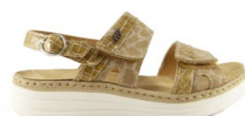
MONIZ 35-42 | Beige CHUT