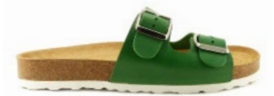
PETRA 35-41 | Vert