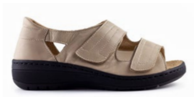
MAFALDA 35-42 | Beige CHUT