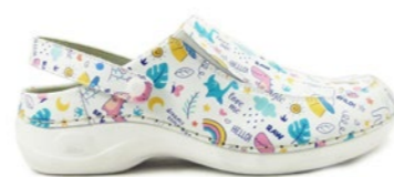
DELI-05C 35-42 | Multicolore CHUT