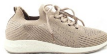
ROSEMARY 36-42 | Beige CHUT