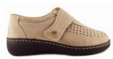
MUSTAFA 35-42 | Beige CHUT