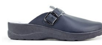
ARIANA 35-41 | Bleu