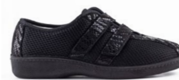
OSNIA 35-41 | Noir CHUT