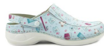
DELI-01D 35-42 | Celeste CHUT