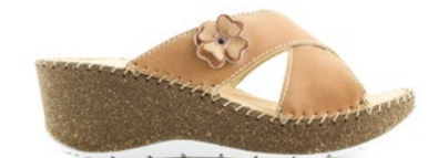
GROTTA 35-41 | Camel