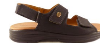
SAM 40-45 | Noir