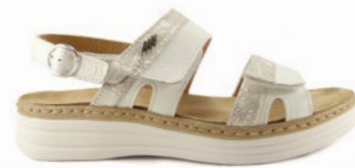
MAURICIO 35-42 | Blanc CHUT