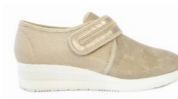
FELINA 35-42 | Beige CHUT