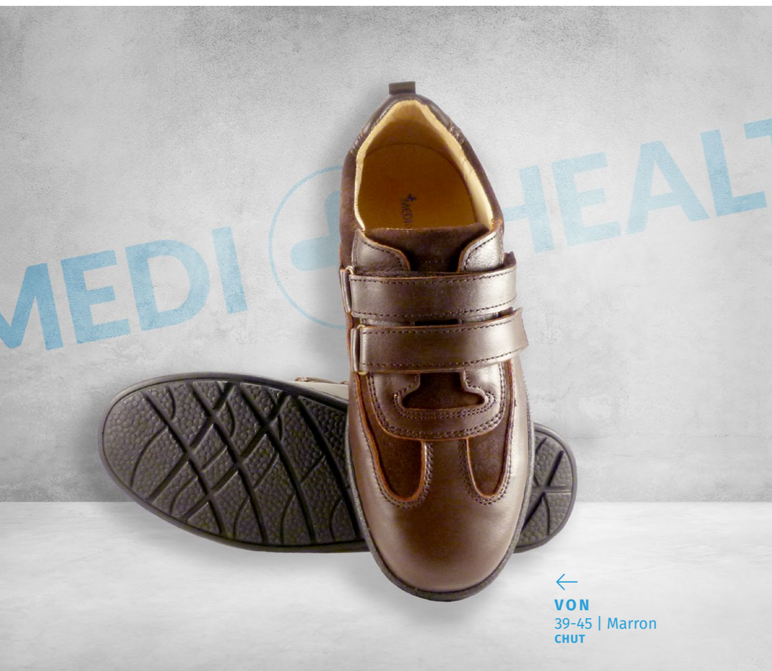
← VON 39-45 | Marron CHUT