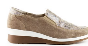
KOPI 35-41 | D'or CHUT