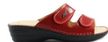
MANCHESTER 35-42 | Rouge, Bleu