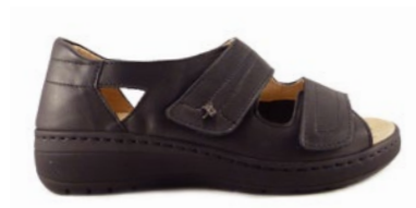
MAFALDA 35-42 | Noir CHUT