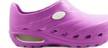
CLOG DINAMIC 35-44 | Rose