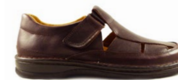
VISION 39-45 | Marron CHUT