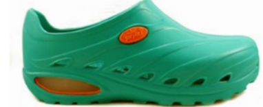
CLOG DINAMIC 35-44 | Vert