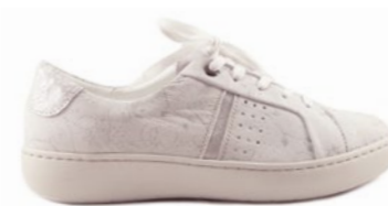
KALIL 35-41 | Blanc CHUT