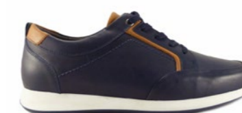
KAI 39-45 | Bleu CHUT