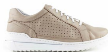
MISSOURI 35-42 | Taupe CHUT