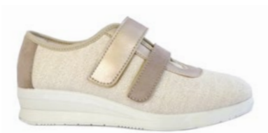
FREDERICA 35-42 | Beige CHUT