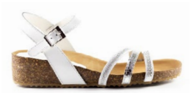
IPOEMA 35-41 | Blanc