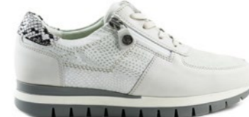
KANELA 35-41 | Argent CHUT