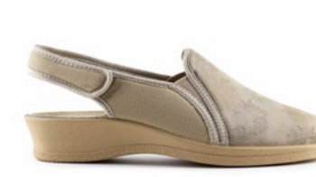
FLURI 35-42 | Beige CHUT