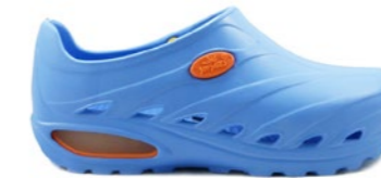
CLOG DINAMIC 35-44 | Bleu