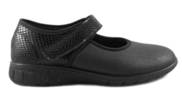
FAGUNDES 35-42 | Noir CHUT