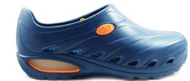
CLOG DINAMIC 35-44 | Marino