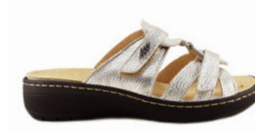
MAIANA 35-42 | Argent