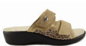
SALIM 35-41 | D'or