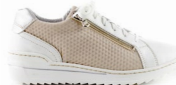
MAYOTTE 35-42 | Blanc CHUT