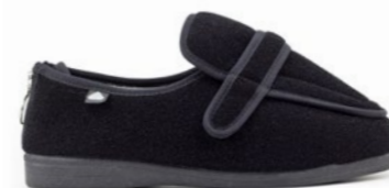
CRISTINA 36-45 | Noir CHUT