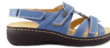
MADOX 35-42 | Bleu CHUT