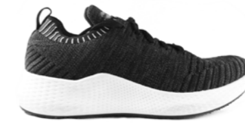
ROME 36-41 | Noir CHUT