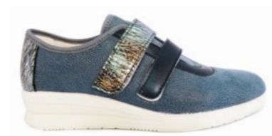
FREDERICA 35-42 | Bleu CHUT