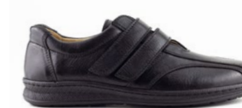
VIGO 39-45 | Noir CHUT