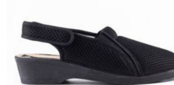
OPALA 35-41 | Noir CHUT