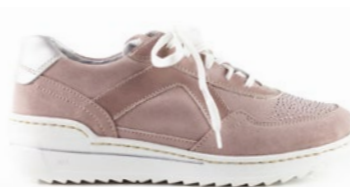
MONTPELLIER 35-42 | Rose CHUT