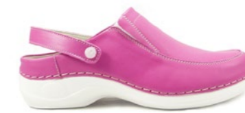
DUBAI 35-42 | Rose CHUT