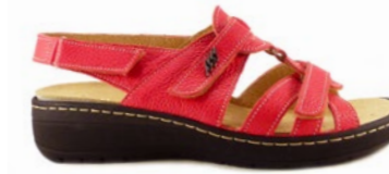
MADOX 35-42 | Rouge CHUT