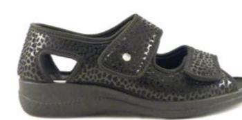
FABIAN 35-42 | Noir CHUT