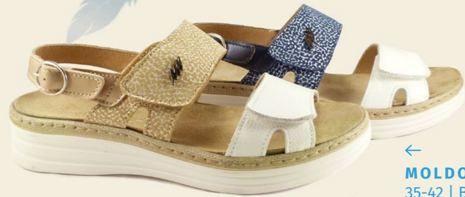
← MOLDOVA 35-42 | Beige, Bleu CHUT