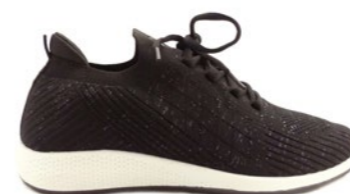
ROSEMARY 36-42 | Noir CHUT

Le port de bonnes chaussures aide à prévenir le gonflement des pieds.