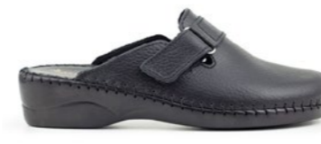
5400 35-41 | Noir