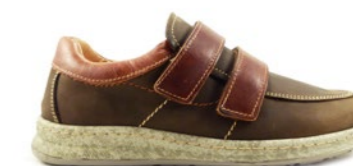
VICTOR 39-45 | Marron CHUT