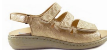
KNUT 35-41 | Doré CHUT