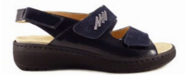
MANTA 35-42 | Bleu CHUT