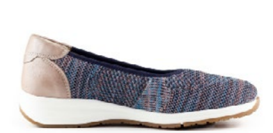
KAFIRA 35-41 | Bleu