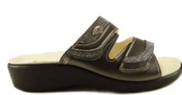
SELMA 35-41 | Gris