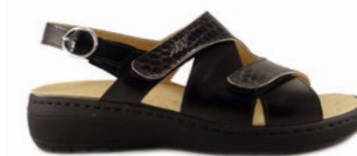
MENGA 35-42 | Noir CHUT