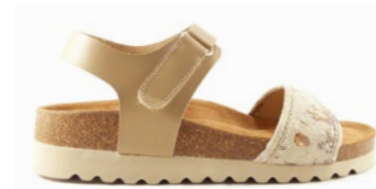
PÉROLA 35-41 | Beige