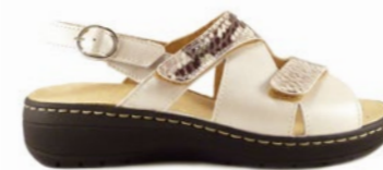
MENGA 35-42 | Beige CHUT